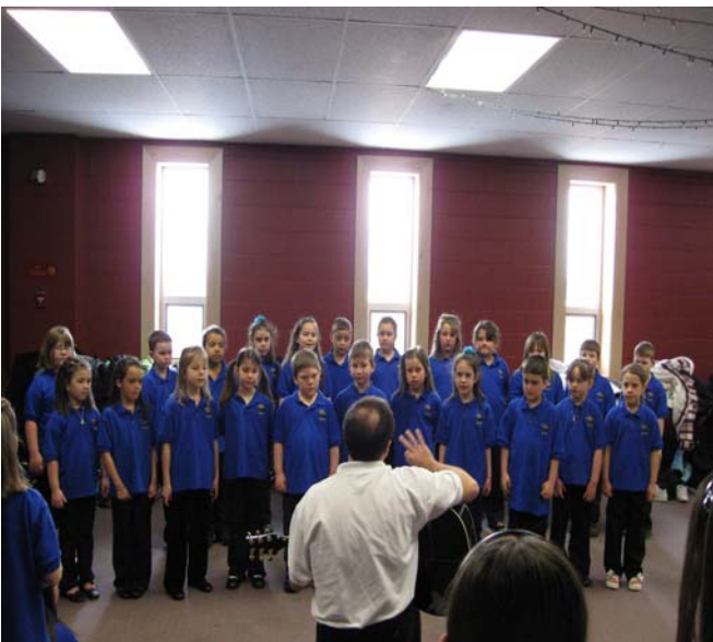
La chorale du primaire

Dans le cadre de leur cours de musique, les chorales primaire et élémentaire de l'école NDC ont eu la chance de faire la démonstration de leur talent au Stephenville Rotary Festival le 3 mars 2009.