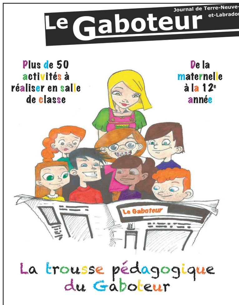
Ci-dessus : la page couverture de la Trousse pédagogique du Gaboteur