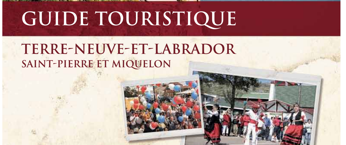
Couverture du guide touristique

nouveautés ne figurant pas dans l’édition précédente du guide. En effet, les différents drapeaux de TNL et celui de SPM y sont inclus avec une brève description. « Comme je reçois de nombreuses questions sur les drapeaux, j’ai pensé qu’il serait bien de les ajouter à cette section », mentionne Mme