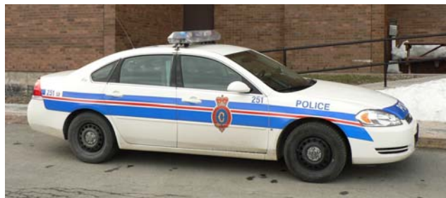
Véhicule policier du RNC

Quand un agent de police le demande, vous devriez lui donner votre nom et votre adresse. Vous n'avez pas à dire quoi que ce soit de plus avant d'avoir parlé à un avocat.