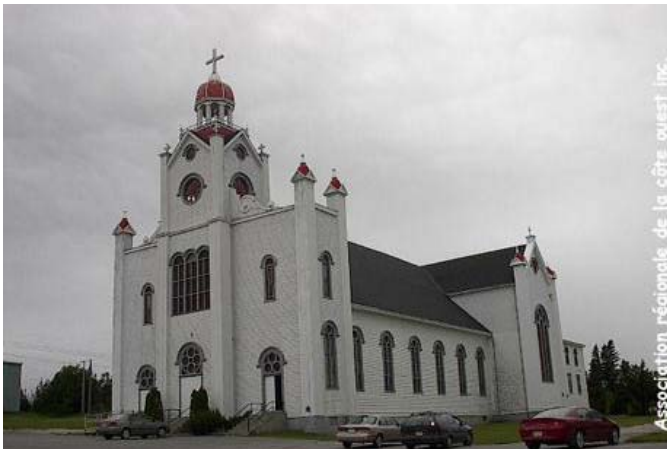
Église Lady of Mercy à Port au Port

La province présente une culture diversifiée composée de personnes de différentes religions. Pour trouver un lieu de culte, consultez les pages jaunes de l'annuaire téléphonique sous Churches & Other Place of Worship .