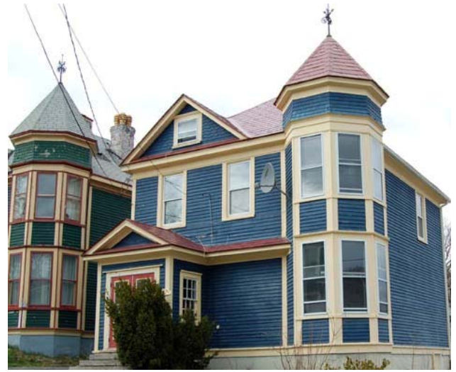
Maison de St-Jean

L'achat d'articles usagés est un moyen moins coûteux d'acheter par exemple des appareils électroménagers, des meubles et des vêtements. Si vous cherchez des appareils électroménagers ou des meubles d'occasion, consultez la section des annonces classées de votre journal local ou une revue d'articles d'occasion à vendre.