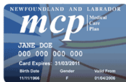
Exemple d'une carte MCP

Votre carte d'assurance médicale ( Medical Care Plan ou carte MCP) est utilisée principalement pour obtenir des soins médicaux. Vous pouvez aussi la présenter pour obtenir un permis de conduire et d'autres services. Les avantages du régime d'assurance-soins médicaux sont expliqués à la section Santé .