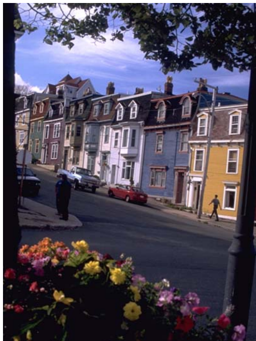
Rue du centre-ville de St-Jean

Autre chose importante à retenir : les abréviations utilisées dans les annonces. Voici les plus courantes : W/D = laveuse/sécheuse, U/I = commodités incluses (électricité, etc.), F/S = réfrigérateurs et cuisinière et POU = commodités à payer.