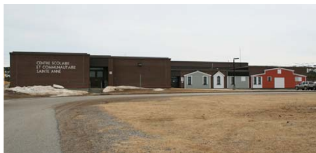
Centre scolaire et communautaire Ste-Anne

Tél. : (709) 778-1000 Sans frais : 1-800-563-9000