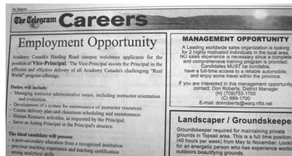
Exemple d'offres d'emploi dans le Telegram .

De nombreuses entreprises placent simplement une affiche dans leur vitrine ( Help Wanted ) – c'est la méthode la plus couramment utilisée par les restaurants et les dépanneurs.