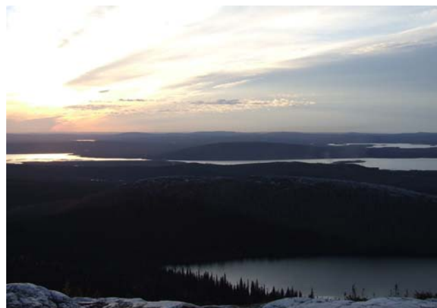
Paysage au Labrador

Bureau de l'immigration et du multiculturalisme C.P. 8700, St-Jean, NL A1B 4J6 Tél. : (709) 729-6607 Courriel : pnnp@gov.nl.ca