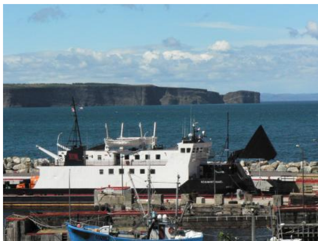
Traversier de Bell Island

Le bateau SPM Express assure des liaisons entre Fortune, au sud de Terre-Neuve et l'archipel français Saint-Pierre et Miquelon. Visitez www.spmexpress.net pour de plus amples renseignements.