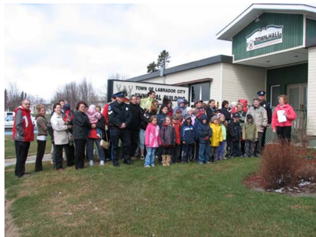
Journée de la francophonie devant l'Hôtel de Ville de Labrador City

Il existe des localités qui ne sont pas constitués en municipalité et où la prestation des services est sous la juridiction du gouvernement provincial. Les territoires non organisés (TNO) (en anglais Local Service District - LSD ) ont un représentant qui est en relation directe avec le gouvernement provincial.