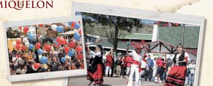
Couverture du guide touristique

TERRE-NEUVE-ET-LABRADOR SAINT-PIERRE ET MIQUELON