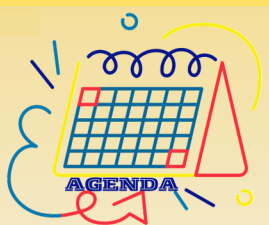
Agenda des activités