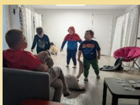
Les enfants à l'honneur à l'AFL