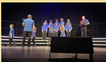
Les chorales scolaires francophones à l'honneur