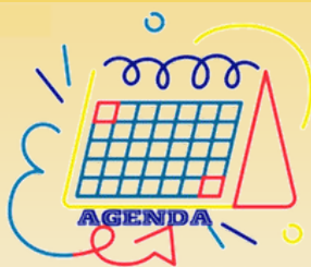
Agenda des activités