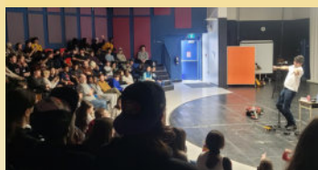
Célébrations de la semaine de la francophonie