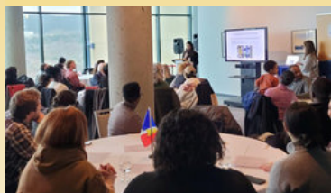
Bienvenue à St-Jean avec AFTNL