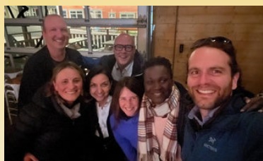
Comité Atlantique sur l'immigration francophone