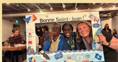
Célébrations de la St-Jean-Baptiste