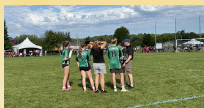
Franco-Jeunes TNL aux Jeux de l'Acadie